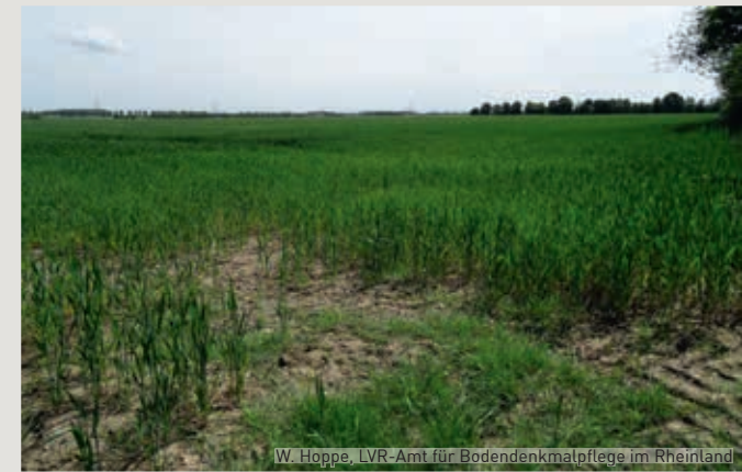
W. Hoppe, LVR-Amt für Bodendenkmalpflege im Rheinland

Becker & Funck Fabrik für Kultur und Stadtteil Binsfelder Str. 77 52351 Düren