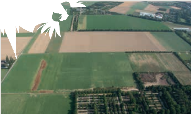
G. Amtmann (†), Düren, LVR-Amt für Bodendenkmalpflege im Rheinland

Die Fundamente der Luftschiffhalle im Luftbild.