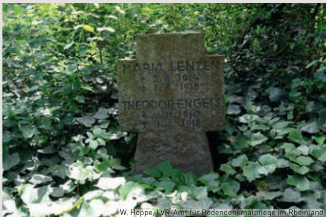
W. Hoppe, LVR-Amt für Bodendenkmalpflege im Rheinland

Vom Luftschiffhafen in Düren starteten von 1915 bis 1917 Militärluftschiffe zu Aufklärungsflügen und zu Luftangriffen nach Frankreich und England. In Düren war das Luftschiff LZ 77 (LZ 107) stationiert. Nach dessen Verlegung wurde die Stahlkonstruktion abgebaut. Die Fundamente der Luftschiffhalle haben Archäologinnen und Archäologen auf Luftbildern entdeckt. Auf einem Teil des Luftschiffhafens liegt heute der Neue Friedhof Düren-Ost. Auf dem Friedhof befinden sich Gräber und Gedenkstätten des Ersten und Zweiten Weltkrieges. In einem Hain sind Steinkreuze mit dem Datum 1.8.1918 zu finden. An diesem Tag fand der erste Luftangriff auf Düren statt.