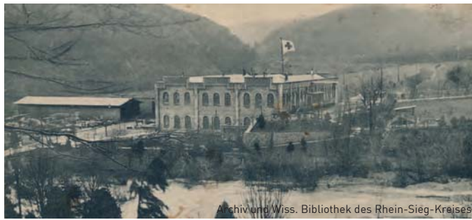
Archiv und Wiss. Bibliothek des Rhein-Sieg-Kreises