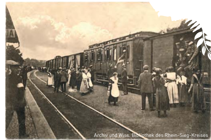
Archiv und Wiss. Bibliothek des Rhein-Sieg-Kreises