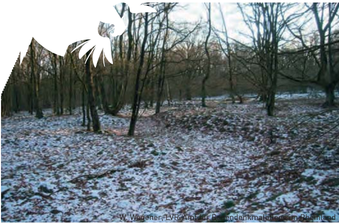
W. Wegener, LVR-Amt für Bodendenkmalpflege im Rheinland