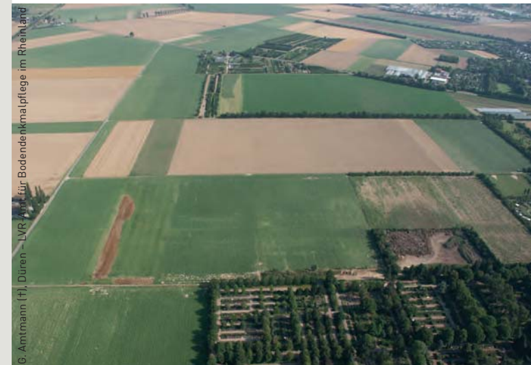
G. Amtmann (+), Düren – LVR-Amt für Bodendenkmalpflege im Rheinland

LVR-Amt für Bodendenkmalpflege im Rheinland Endericher Straße 133, 53115 Bonn Tel 0228 9834-0 Fax 0228 9834-119 www.bodendenkmalpflege.lvr.de