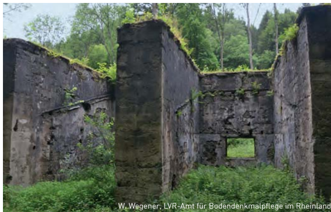
W. Wegener, LVR-Amt für Bodendenkmalpflege im Rheinland

Treffpunkt/Präsentation: Halle „kabelmetal“, Schönecker Weg 5, 51570 Windeck-Schladern. Parkmöglichkeit: P+R-Anlage an der Bahnstraße, 51570 Windeck-Schladern. | Infopunkt Pulvermühle: Elisentalstraße, 51570 Windeck-Dattenfeld. Parkmöglichkeiten: Bahnhof Dattenfeld, Engbachstr. 28, 51570 Windeck (von hier aus Beschilderung folgen); Museumsdorf Altwindeck, Im Thal Windeck 17, 51570 Windeck.