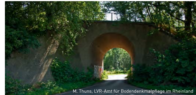
M. Thuns, LVR-Amt für Bodendenkmalpflege im Rheinland

Treffpunkt/Präsentation: Ehemalige Synagoge Hülchrath, Broichstr. 16, 41516 Grevenbroich. | Infopunkt Strategischer Bahndamm: Straßenkreuzung Auf der Heide/Am Reiherbusch, 41516 Grevenbroich.