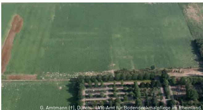
G. Amtmann (+), Düren – LVR-Amt für Bodendenkmalpflege im Rheinland

Treffpunkt/Präsentation: Becker & Funck – Fabrik für Kultur und Stadtteil, Friedensstr. 2B, 52351 Düren. | Infopunkt Luftschiffhafen: Im Rossfeld, 52351 Düren.